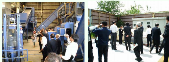
【カメラファクトリー】