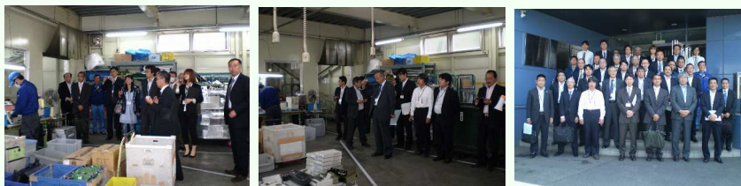
【アドニスファクトリー】